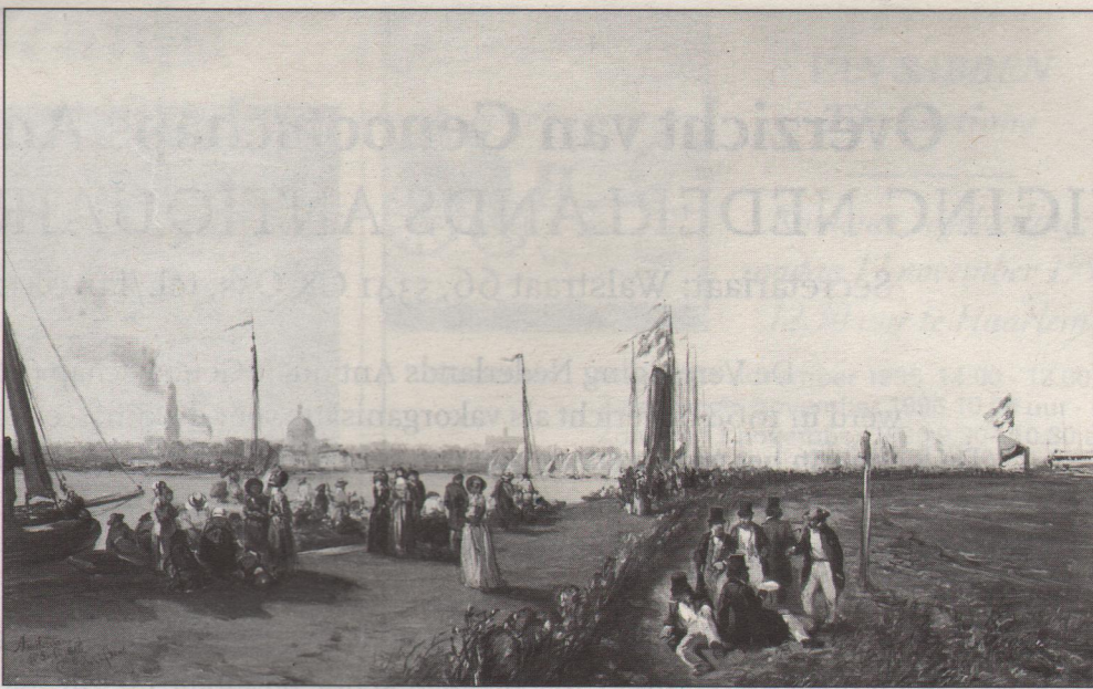
Ch. Rochussen 'Zeilwedstrijd op het IJ in 1846'. In 1985 geveild bij Christie's voor fl. 40.000.

Behalve deze voor het vak specifieke kanten zijn er natuurlijk ook de aspecten van al dan niet goed inkopen en van winstmar-